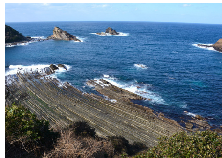
須々海海岸(松江市島根町)