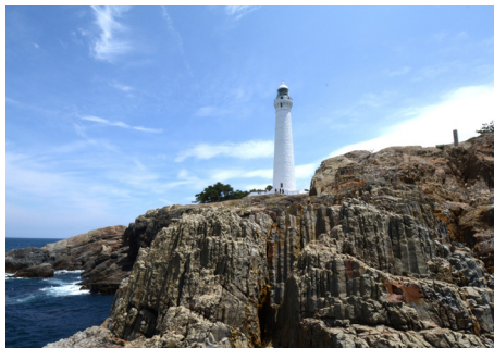
日御碕(出雲市大社町)